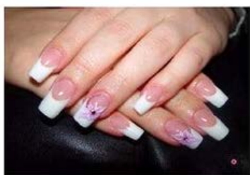
Маникюр со стразами и рисунком